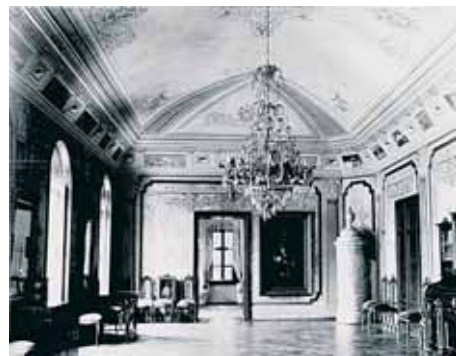
Radvanský kaštieľ – pôvodné zariadenie.

19. storočie bolo dobou maďarizácie rodu Radvanských, ktorí napriek tomu stále ovládali aj slovenský jazyk – aj keď na verejnosti vystupovali ako „maďarskí“ uhorskí patrioti. Počas celého obdobia žili Radvanskovci vo