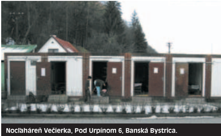
Noclaháreň Večierka, Pod Urpinom 6, Banská Bystrica.