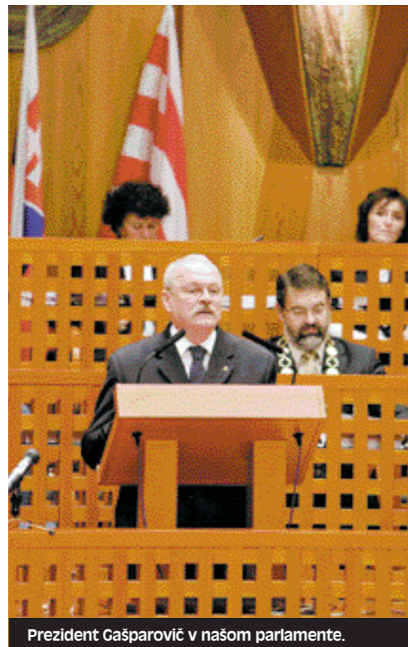
Prezident Gašparovič v našom parlamente.

Prezident v mestskom parlamente hovoril aj o dobrej pôde Banskej Bystrice pre Európske mesto kultúry. „ Banská Bystrica je, keďže som z tohto Stredoslovenského kraja, aj mojím krajským mestom. Poznám aj niektoré historické časti Banskej Bystrice. Som presvedčený, že si to zaslúži. Bola vždy aj centrom vzde-